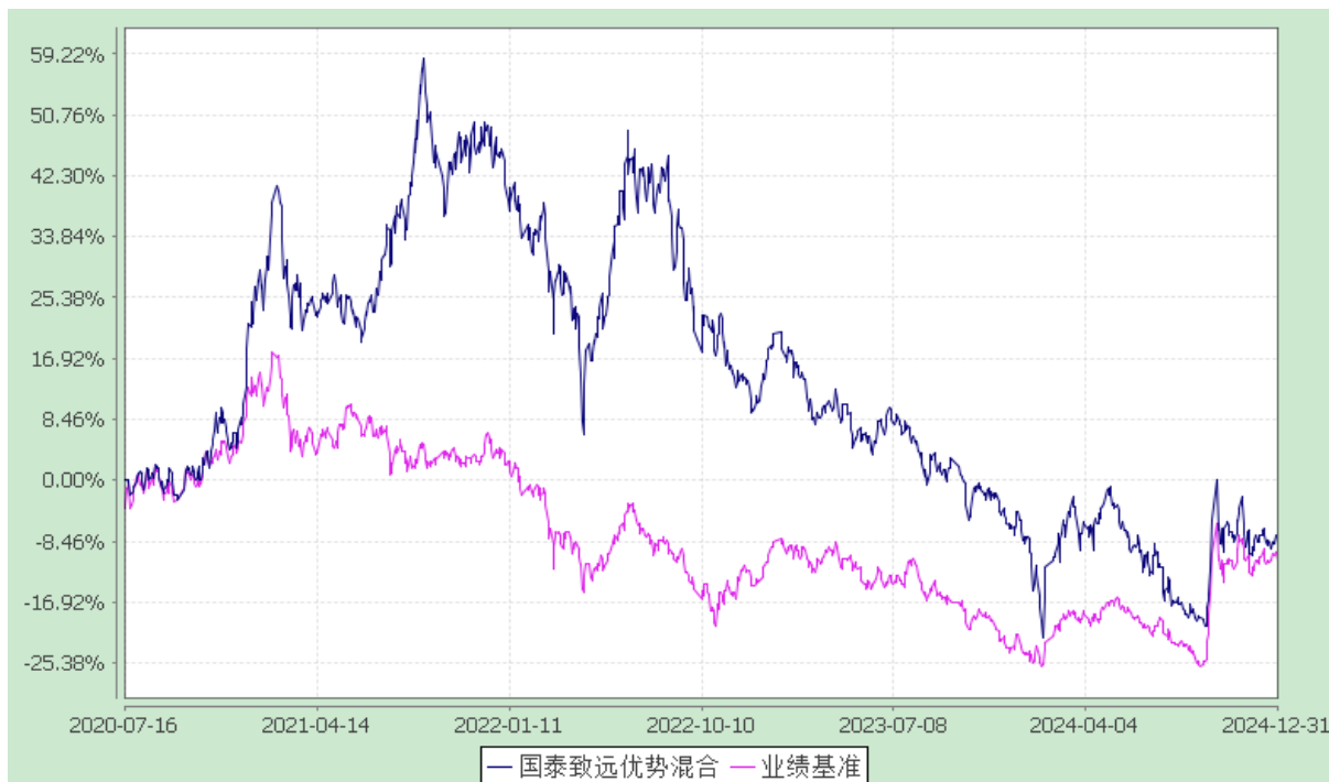
自基金合同生效以来份额累计净值增长率与业绩比较基准收益率的历史走势对比图 (2020 年 7 月 16 日至 2024 年 12 月 31 日)

注：本基金合同生效日为 2020 年 7 月 16 日，在六个月建仓期结束时，各项资产配置比例符合合同约定。