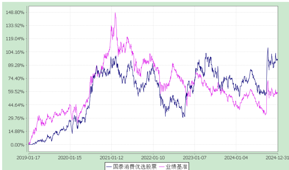
自基金合同生效以来份额累计净值增长率与业绩比较基准收益率的历史走势对比图 (2019 年 1 月 17 日至 2024 年 12 月 31 日)

注：本基金合同生效日为 2019 年 1 月 17 日，本基金的建仓期为 6 个月，在建仓期结束时，各项资产配置比例符合合同约定。