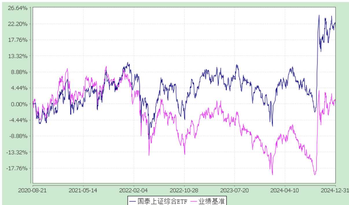
自基金合同生效以来份额累计净值增长率与业绩比较基准收益率的历史走势对比图 (2020 年 8 月 21 日至 2024 年 12 月 31 日)

注：本基金合同生效日为 2020 年 8 月 21 日，在六个月建仓期结束时，各项资产配置比例符合合同约定。